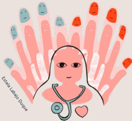
Estela Labejo Duque